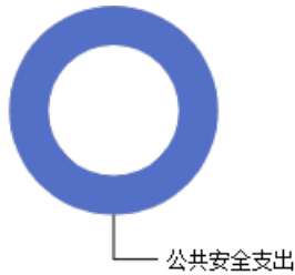
一般公共预算当年拨款结构图