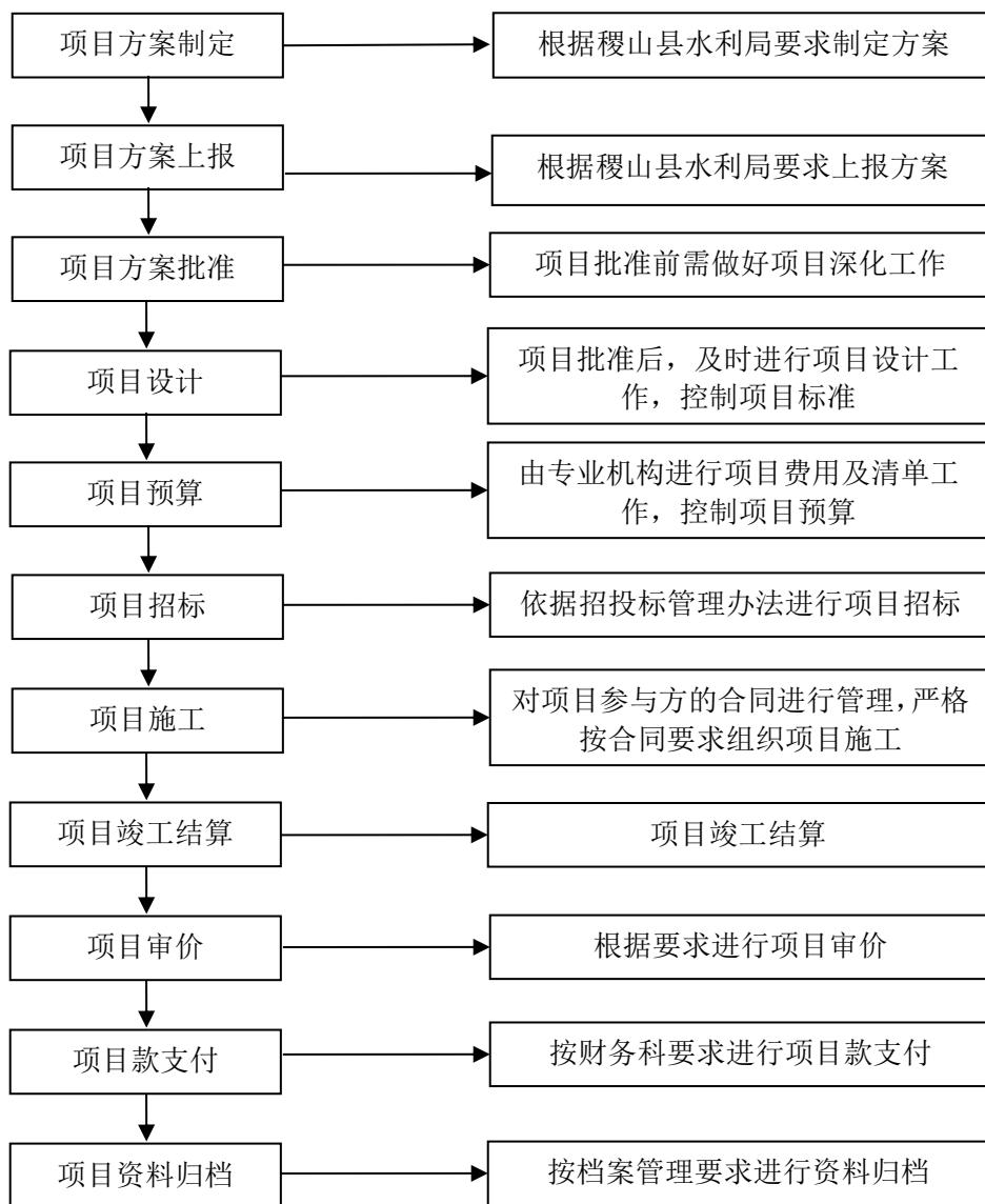
图 1-2 项目管理流程图