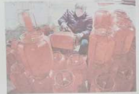
县教育局组织捐赠爱心长椅，方便社区居民。

县教育局相关负责人表示，通过开展“捐赠爱心长椅”活动，能够有效提升社区服务水平，方便社区居民。未来将继续开展此类公益活动，为社区居民提供更加优质的服务。