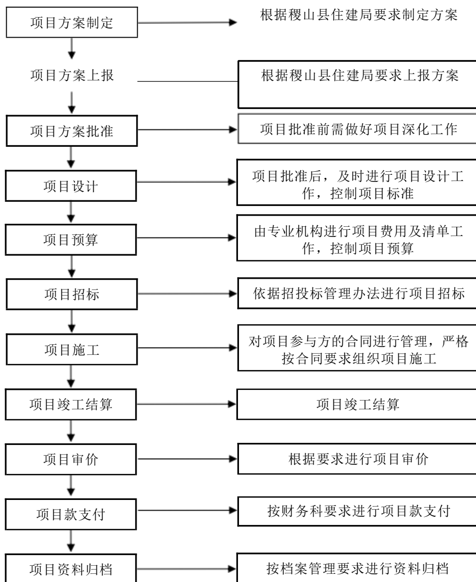
图 1-3 项目管理流程图